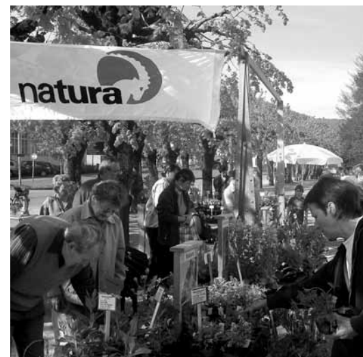
Wie seit Jahren fanden auch 2007 in zahlreichen Baselbieter Gemeinden Wildpflanzenmärkte statt. Die Daten der Wildpflanzen- und Kräutermärkte in diesem Jahr finden Sie auf Seite 8 dieses Heftes.