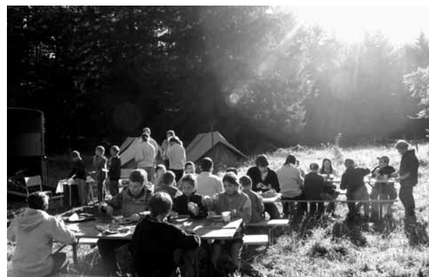
Essenszeit im Räuber-Zeltlager des Jugendnaturschutz im Jura. Auch dieses Jahr findet in den Sommerferien ein Zeltlager statt (siehe Seite 8), für einmal innerhalb des gesamtschweizerischen Jugendanlasses Ökotopia.