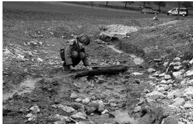
Die Aktion «Gummistiefelfeld BL» wurde erfolgreich gestartet. Neben dem Hintereggbächli in Wenslingen wurden weitere zwei Wiesenbäche in Oltingen und Rünenberg ausgedolt.