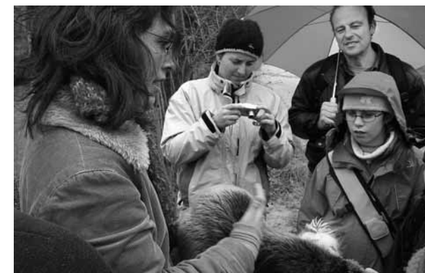
Im Rahmen des Erlebnisprogrammes «Lebendiger Hochrhein» haben vier Naturschutzorganisationen aus der Schweiz und aus Deutschland (HALLO BIBER!, VANV, BABU, BUND) zu Exkursionen, Führungen und anderen Aktivitäten entlang des Rheins von Waldshut bis Basel eingeladen und rund 20 Anlässe durchgeführt.