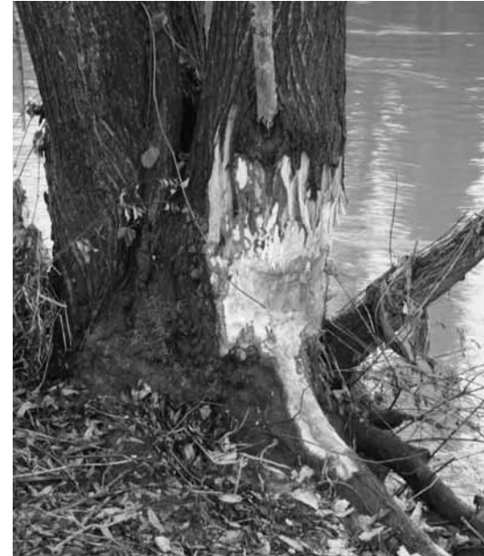
... Dieser hat sich an der Ergolz beim Hülfenfall niedergelassen, eine Familie gegründet und hinterlässt nun unübersehbare Spuren.