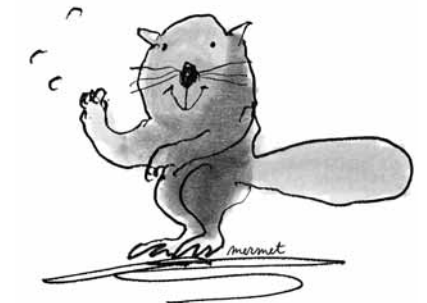
HALLO BIBER! EINE 10-JAHRES-AKTION VON PRO NATURA BASELLAND