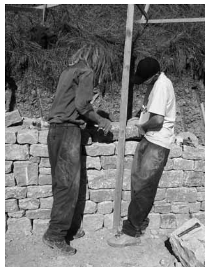
Im Naturschutzgebiet Ramstel in Rothenfluh bauten die Gärtnerlehrlinge die dritte Etappe ihrer Trockensteinmauer. 2008 folgt der vierte Teil. Ausserdem wird dieses Jahr ein Trockenmauerkurs in Maisprach für Naturschützer und weitere Interessierte durchgeführt (siehe S. 7)

Pro Natura Baselland hat 2007 gleich drei neue Mehrjahresaktionen erfolgreich gestartet: Das Projekt «Hopp Hase» soll den Feldhasen auf die Sprünge helfen, und die Kampagne «Tagfalterschutz BL» soll seltene Schmetterlingsarten fördern. Mit ihrer neuen Aktion «Gummistiefelfeld-BL» widmet sich Pro Natura Baselland den kleinen und kleinsten Fließgewässern, welche seit Jahrzehnten unbenutzt in Röhren fließen. Diesen Schatz möchten wir heben – zugunsten von Feuersalamander, Iltis und Prachtlibelle.