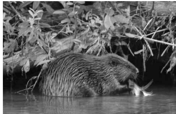
Ein historisches Bild: Das erste Foto eines Baselbieter Bibers ...