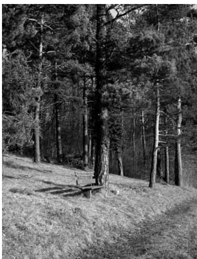
In solch lichten Föhrenwäldern – wie wir sie beispielsweise im Naturschutzgebiet Chilpen in Diegten finden – fühlen sich sowohl die Bergzikade Cicadetta montana wie auch die neue Art Cicadetta cantilatrix wohl.