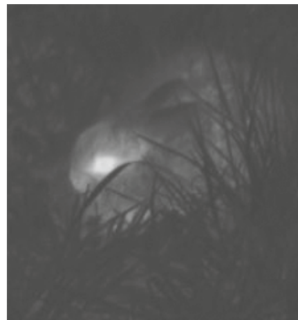
So sieht ein Hase durch die Wärmebildkamera aus.