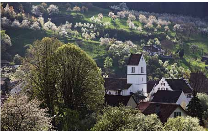
Blütenmeer der Hochstamm-bäume in Oltingen; Kalenderblatt aus dem Kalender Natur 2013 von Pro Natura Baselland (siehe S. 8)

• Keine Orchideen. An den seit Jahren von Pro Natura Baselland organisierten und durchgeführten Wildpflanzenmärkten werden keine Orchideen verkauft, dafür aber unzählige andere Wildstauden, Kräuter und Sträucher. Insgesamt sind in 13 Gemeinden Tausende von Wildstauden und Kräutern über die Markttische gegangen. Diese wachsen und blühen nun in den verschiedensten Gärten der ganzen Region, ziehen viele Schmetterlinge und andere Insekten an und landen sogar als Gewürz oder Tee in der einen oder anderen Küche. Die Nachfrage ist weiterhin sehr gross, viele Märkte gehören bereits zum Jahreskalender der Gemeinde. So sollen im nächsten Jahr wieder alle Märkte durchgeführt werden. Im November dieses Jahres findet zum dritten Mal der Wildsträuchermarkt in Liestal statt, und zwar am 3. November, von 9-13 Uhr im Stedtli Liestal. Informationen und Sonderwünsche bis 20. Oktober an Pro Natura Baselland, tel 061 921 62 62, fax 061 923 86 51, mail pronatura-bl@pronatura.ch .