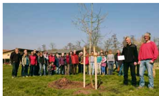
Der Naturschutzpreis 2016 ging an die Genossenschaft Agrico Birsmatthof in Therwil für die langjährige Versorgung der Region mit saisonalem und ökologisch produziertem Gemüse sowie die Förderung der Naturwerte auf ihrem Hofgelände. Im Beisein von zahlreichen Genossenschafterinnen und Genossenschaffern wurde als Preisbaum eine Eiche gepflanzt.