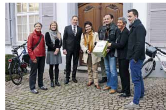
Innerhalb nur eines Monats sammelten wir gemeinsam mit dem BNV unter der Federführung der Naturschutzvereine Reinach und Aesch über 5000 Unterschriften gegen die Durchführung des Eidgenössischen Schwing- und Äplerfests zwischen Aesch und Reinach. Dort brüten dank ökologischen Aufwertungsmassnahmen im Rahmen der 10-Jahresaktion «Hopp Hase» seltene Vögel wie Schwarzkehlchen, Neuntöter und Wendehals, und die Dichte des Feldhasen hat deutlich zugenommen.