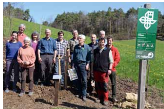
Im Naturschutzgebiet pflanzten wir zum doppelten Jubiläum 70 Jahre Naturschutzgebiet Chilpen und 50 Jahre Pro Natura Baselland eine Wildbirne und weiheten sie feierlich ein.