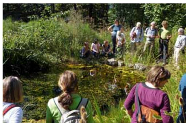
Gemeinsam mit dem BNV führte Pro Natura Baselland in Sissach einen gut besuchten Weihersanierungskurs durch. Ohne fachgerechte Pflege und bei Bedarf eine grössere Sanierung verlieren die Biotope rasch an ökologischem Wert.