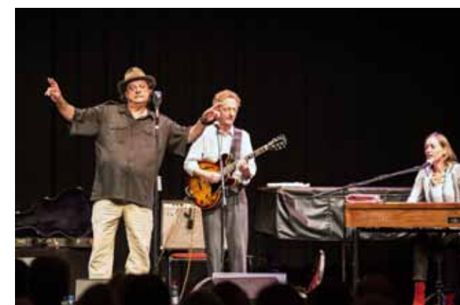
Zum Abschluss der 10-Jahresaktion «Hopp Hase», welche gemeinsam mit BNV und Jagd Baselland durchgeführt wurde, wurden die zahlreichen Freiwilligen, Sponsoren und weitere Beteiligte zu einem Konzert von Stiller Has in Laufen eingeladen.