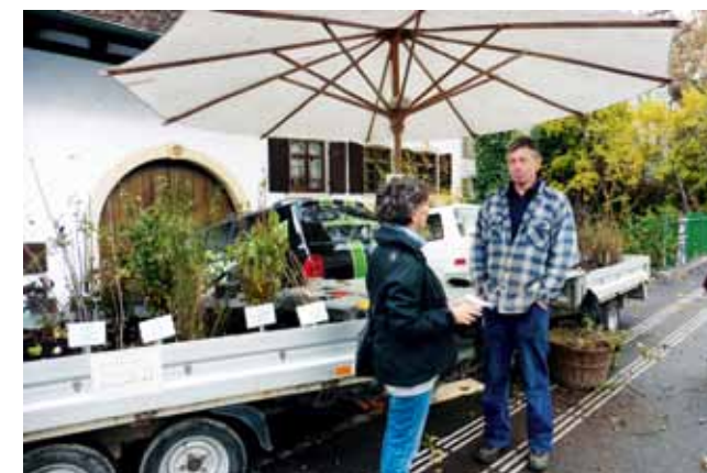
Der Wildsträuchermarkt im Herbst fand erstmals in Sissach statt und war gut besucht. Im Frühjahr wurden in guter Zusammenarbeit mit lokalen Vereinen Wildpflanzenmärkte in 14 Gemeinden des Baselbiets durchgeführt.