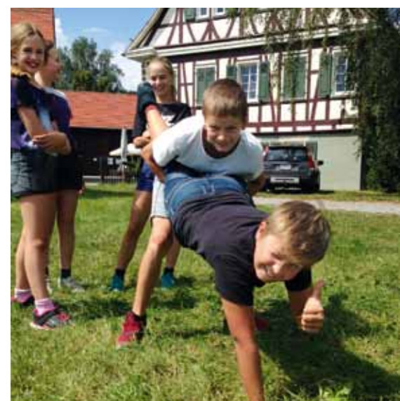
Der Jugendnaturschutz Baselland führte sein traditionelles Sommerlager erstmals im Ausland durch. Auf der Schwäbischen Alb befassten sich die Kinder mit dem Thema «Zauberei» und lernten die Natur in Deutschland kennen.