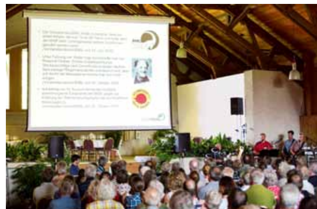
Am Jubiläumsfest in Brülingen wurde den 150 Gästen mittels einer musikalisch begleiteten Powerpoint-Präsentation die 50-jährige Geschichte von Pro Natura Baselland in Erinnerung gerufen.