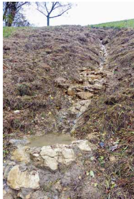
Im Naturschutzgebiet Bergmätteli in Zunzgen renaturierten wir eine zuvor gefasste Quelle.