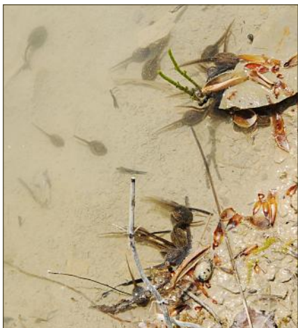
... und alsbald in Beschlag genommen wurden.

Eine weitere Möglichkeit, ohne teure bauliche Massnahmen auszukommen, ist – so simpel es klingen mag – der Verzicht. Auch in unserem v.a. in Stadtnähe und in den Haupttälern dicht besiedelten