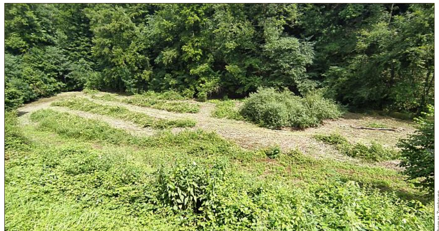
Unterhalb des Kilchberger Giessen darf der Eibach über die Ufer treten, ohne dass dies jemanden stört.