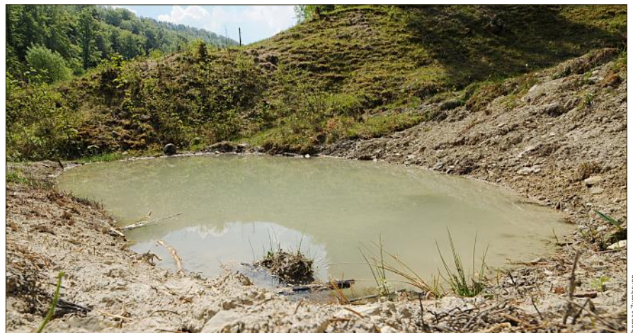
Nach einem Hangrutsch im Tal (Itingen) bildeten sich Tümpel, die mit dem Bagger etwas vergrössert ...