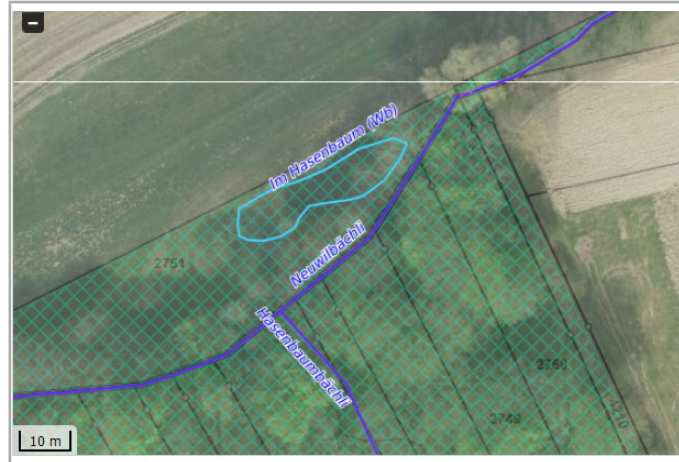
Kantonales Gewässernetz 1996, Kommunale Naturschutzzone (Überlagern / Grundnutzung), Inventar der kantonal geschützten Naturobjekte Plangrundlagen: GIS-Fachstelle BL