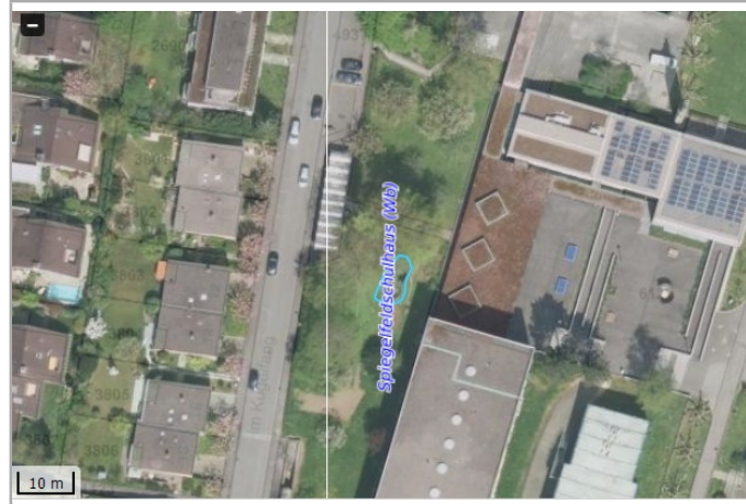
Kantonales Gewässernetz 1996 Kommunale Naturschutzzone (Überlagern / Grundnutzung) Inventar der kantonal geschützten Naturobjekte Plangrundlagen: GIS-Fachstelle BL