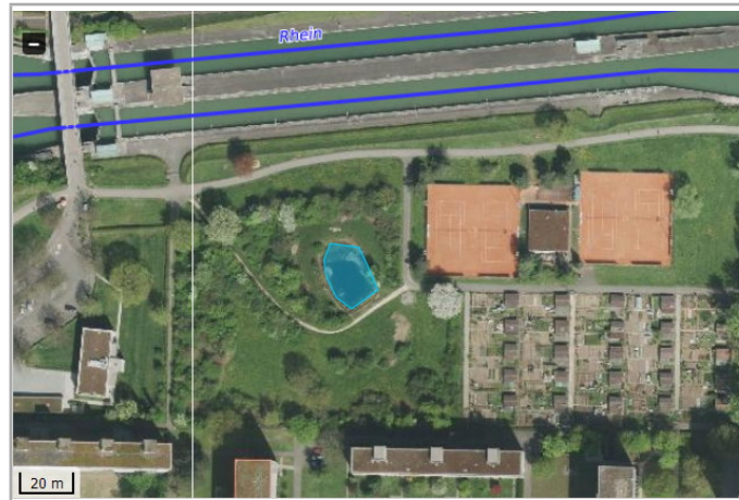
Kantonales Gewässernetz 1996, Kommunale Naturschutzzone (Überlagernd / Grundnutzung), Inventar der kantonal geschützten Naturobjekte Plangrundlagen: GIS-Fachstelle BL