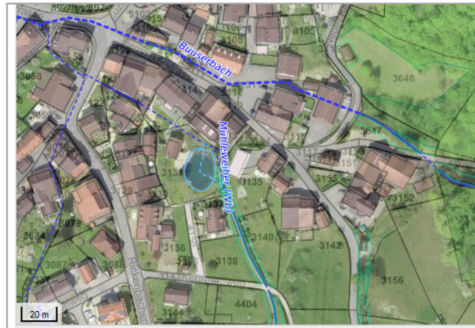
Kantonales Gewässernetz Kommunale Naturschutzzone (Überlagern / Grundnutzung) Inventar der kantonal geschützten Naturobjekte Plangrundlagen: GIS-Fachstelle BL