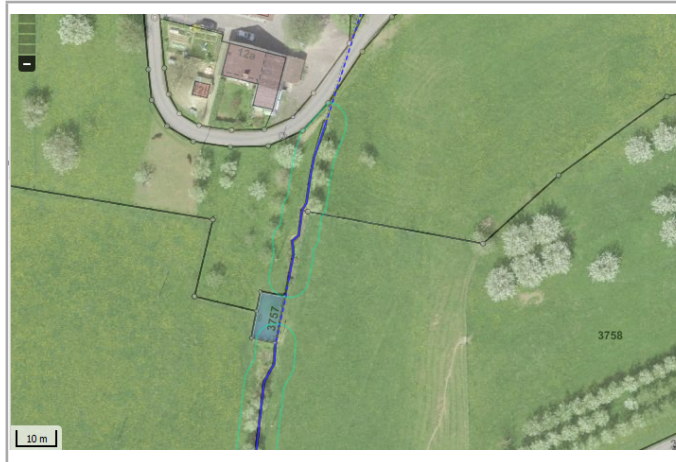
Kantonales Gewässernetz Kommunale Naturschutzzone (Überlagernd / Grundnutzung) Inventar der kantonal geschützten Naturobjekte Plangrundlagen: GIS-Fachstelle BL