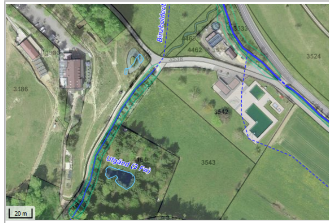
Kantonales Gewässernetz Kommunale Naturschutzzone (Überlagern / Grundnutzung) Inventar der kantonal geschützten Naturobjekte Plangrundlagen: GIS-Fachstelle BL