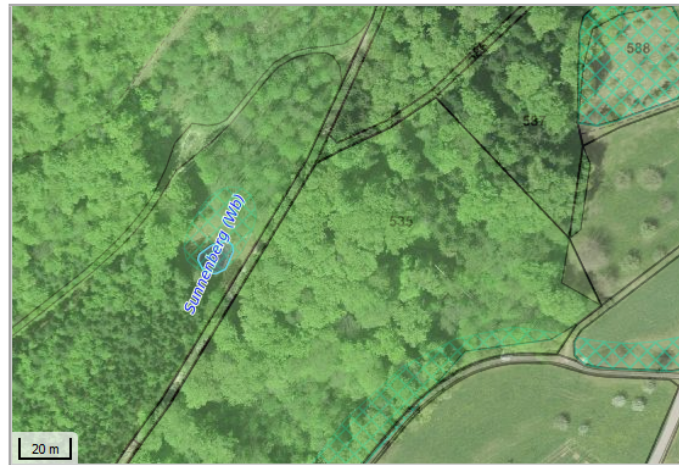
Kantonales Gewässernetz 1996 Kommunale Naturschutzzone (Überlagern / Grundnutzung) Inventar der kantonal geschützten Naturobjekte Plangrundlagen: GIS-Fachstelle BL