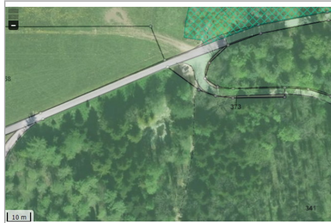
Kantonales Gewässernetz 1996 Kommunale Naturschutzzone (Überlagern / Grundnutzung) Inventar der kantonal geschützten Naturobjekte Plangrundlagen: GIS-Fachstelle BL