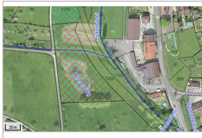
Kantonales Gewässernetz Kommunale Naturschutzzone (Überlagern / Grundnutzung) Inventar der kantonal geschützten Naturobjekte Plangrundlagen: GIS-Fachstelle BL