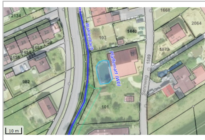
Kantonales Gewässernetz Kommunale Naturschutzzone (Überlagern / Grundnutzung) Inventar der kantonal geschützten Naturobjekte Plangrundlagen: GIS-Fachstelle BL